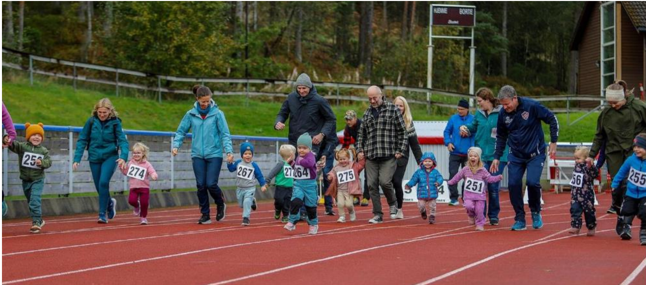
Frå starten på «Knøtteløpet» under Kvinnheradmeisterskapen, 100 meter for 0-5-åringane.

Friidrettsgruppa har hatt eit år med god aktivitet og gode prestasjonar. Vi er ei lita gruppe, og bygger oss gradvis opp. I året som har gått har vi fått i gong enda ei treningsgruppe, og har no 4 grupper frå 6-14 år. Friidrettsgruppa brukar Trio si nettside aktivt rundt våre arrangement. Vi har i tillegg ei eiga Facebookside for Friidrettsgruppa, men syt også for å alltid bruke Trio si felles Facebookside til å nå ut med informasjonen vår. Det er viktig for å nå ut til flest mogleg. Treningsgruppene brukar i tillegg Spond til intern informasjon om treningar.