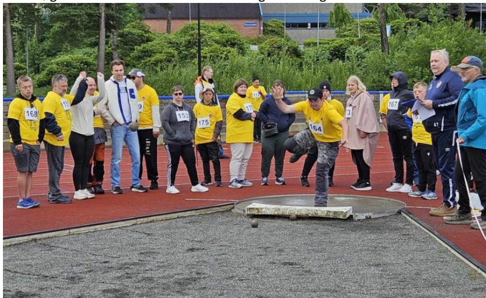
Stor iver i kuleringen på Løveleikene.

Som nemnt arrangerte vi Løveleikene igjen, denne gongen som eine-arrangør, då dei lokale Lionsklubbane no er nedlagt. Likevel har vi uvurderleg hjelp til gjennomføring i tidlegare Lionsmedlemmar og karar frå Trio sin onsdagsgjeng. Årets Løveleiker vart ein formidabel festdag. Sidan det vart samkøyrd med leir på Halsnøy Folkehøgskule er deltakartalet over dobla og no om lag 90 deltakarar. Dette må vi klare å føre vidare!