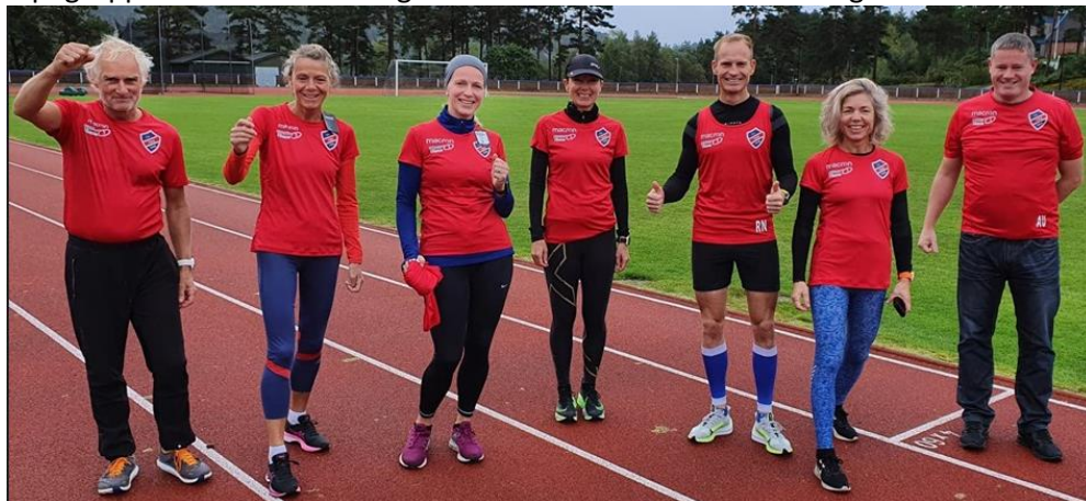
Alltid god stemning i løpegjengen.

Med utspring i triathlongjengen er det felles løpstreningar 3 gonger i veka. Vår veldig aktive Triathlon-/løpegruppe er inkluderande og flinke til å annonsere ulike treningsøkter.