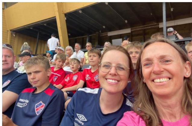
Til venstre: Matpause midtvegs i 10-kampen i august. Til høgre: Teambuilding med Trond Mohn Games på Fana stadion.