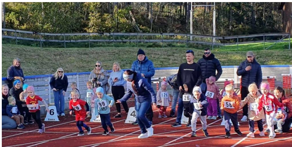
Frå starten på Knøtteløpet, 100 meter for 0-5-åringane.

Som nemnt arrangerte vi Løveleikene igjen, og dette vart siste gongen det var i lag med Lionsklubbane, då desse vart nedlagt i sommar. Vi håpar å kunne overta som arrangør åleine til neste år. For årets Løveleiker vart ein enda større festdag enn det nokon gong har vore før. Sidan det vart samkøyrd med leir på Halsnøy Folkehøgskule vart deltakartalet nær 100, over det doble av kva vi har hatt tidlegare. Dette må vi klare å føre vidare!