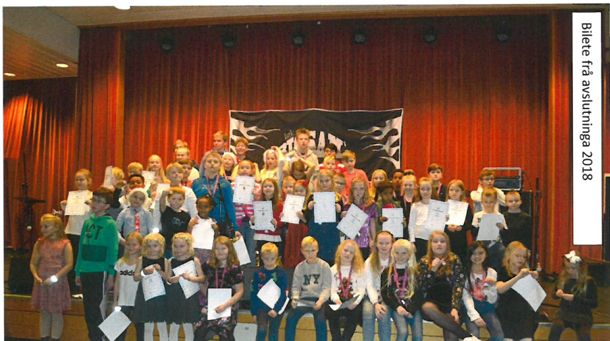
Billete frå avslutninga 2018

Juleavslutninga for symjegruppa var også i år ein stor suksess, litt i overkant av 30 symjarar var med å setje ein flott og minneverdig avslutning på 2019 sesongen. Den yngste deltakaren frå symjeskulen var 6 år og deltok saman med fleire andre for fyrste gong på symjestemne. Vel 200 personar var med å setje krona på avslutninga i Kulturhuset med kakefest, loddsal og premieutdeling til alle deltakarane.