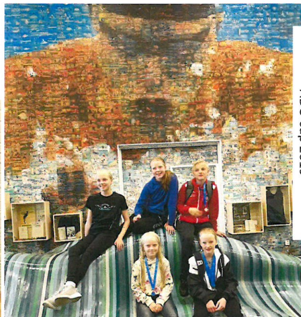
ADO cup 2019